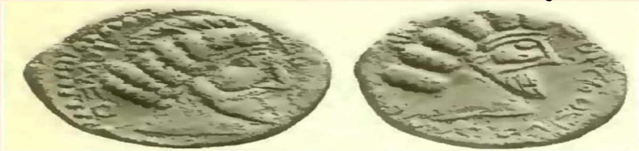
نقود من عهد ثيونيسيوس الثالث

● الملك ثيونيسيوس الثالث (Theonesios III): وكان الملك الرابع عشر لمملكة ميسان خلال الفترة (١١٠ - ١١٥ بعد الميلاد) ويعرف حكمه بالعملات المعدنية التي سكها. ويشير توزيع عملاته المعدنية عبر المنطقة إلى أن عهده كانت فيه التجارة واسعة النطاق وفي عهده أيضاً أنحسرت سيطرة الفرثيين على ميسان حيث أستطاع هذا الملك أن يحرز بعض الانتصارات وأن يعيد ميسان إلى ما كانت عليه في عهد أتامبيلوس الثالث حيث خلد أنتصاراته بنقش بعض الرموز على مسكوكاته مثل (النجمة السداسية والسعفة). أن وجود نجمة داود والسعفة لهما الدلالة بكون الديانة اليهودية قد أخذت شوطاً من تاريخ ميسان بعد أن تزوج بعض ملوكها من بنات التجار اليهود لدرجة أعتناقهم اليهودية. وتصادت الأحداث في المنطقة بعد بأعتلاء "تراجان" عرش روما الذي أبدى اهتماماً خاصة بتسهيل التجارة البحرية لميسان حيث أعاد فتح القناة الرابطة بين النيل والسويس وضم مملكة الأنباط في حدود عام ١٠٦ بعد الميلاد إلى إمبراطوريته. وأنضمت تدمر اليه ضمن اتحاد سياسي وقامت بدور الوسيط التجاري. وفي عام ١١٤ بعد الميلاد أعلن "تراجان" حرباً شاملة ضد الفرثيين وقادها بنفسه في حملته إلى الشرق بدوافع منها تحقيق حلمه للتشبه بالأسكندر المقدوني في سيطرته على العالم القديم وللتقليل من السيطرة الفرثية بالإضافة إلى أسباب اقتصادية تتمثل في السيطرة على التجارة العالمية لذلك كثر التعامل بالنقود الفضية والذهبية في الاسواق الرومانية لشراء البضائع العربية والهندية.